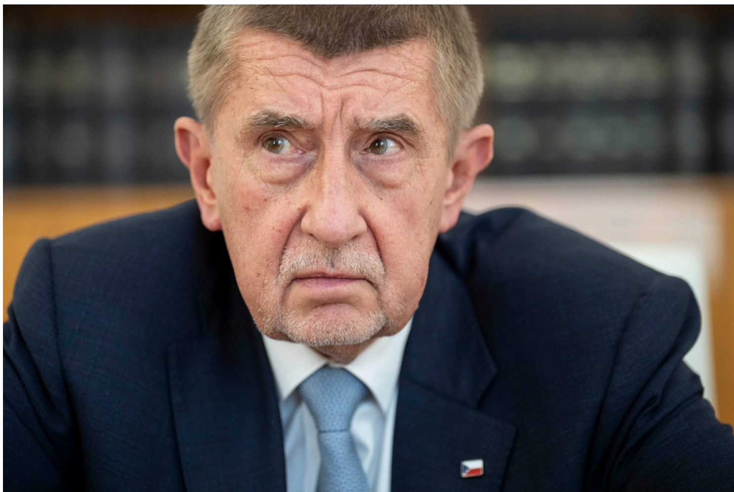
Андрей Бабиш, премиер на Чехия в периода 2017 – 2021 г. и от декември 2025 г.

Въпреки това редица анализатори твърдят, че повторното встъпване в длъжност на Андрей Бабиш като министър – председател на Чехия е възможно да „разтопи ледовете“ в отношенията с Пекин. На 20 април 2026 г. Бабиш заявява, че „иска по-прагматична външна политика, която да не вреди на бизнес връзките с Китай“.