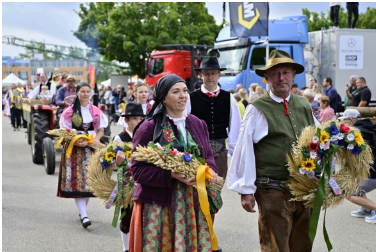
Кадър от изложението „Země živitelka“ през 2025 г.

Най-голямото международно изложение за селско стопанство в Чехия е „Země živitelka“ , което се провежда традиционно в град Ческе Будейовице през месец август всяка година.